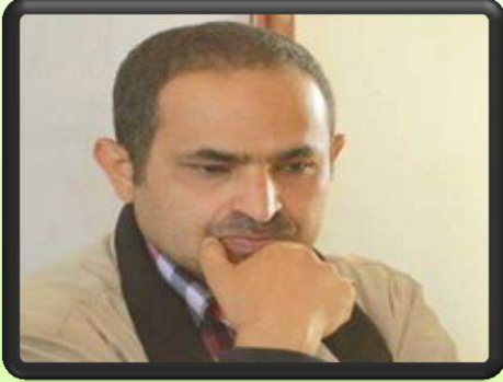
حاوره / سمية الطانفي