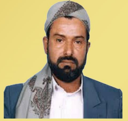
السيد /حسين بدر الدين الحوثي

ثقوا بنصر الله وإن وجدتم هؤلاء المعتدين محيطين بالبلاد من كل جانب فالله معنا وهو ناصرنا وهو حسبنا ونعم الوكيل وكفى بالله وليا وكفى بالله نصيرا .