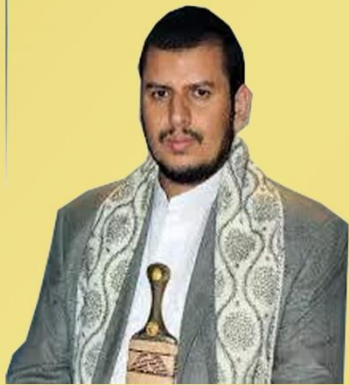
السيد /عبدالملك بدر الدين الحوثي

نقول لكل أولئك الظالمين العملاء المفسدين أنا نرى أنا أقوى منكم لأننا في إطار ولاية الله سبحانه وتعالى الأقوى والأعظم من كل أولئك الذين تتولاهم من الجبابرة والظالمين الذين هم تحت قهرة.